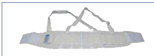
Cargo branca (BC)