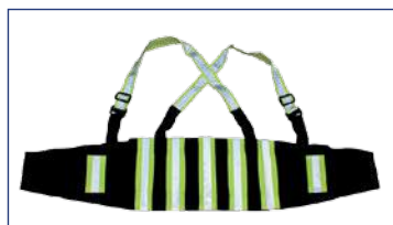
Cargo refletiva full (RF)