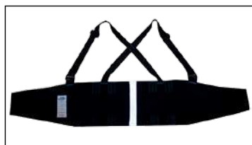
Cargo refletiva simples (RS)